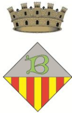
Ajuntament de Banyoles